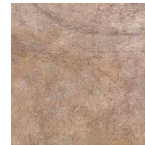
NA070 Nature Nut 33.3x33.3 13"x13"