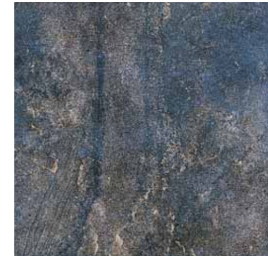
NA030 Nature Blu 33,3x33,3 13"x13"