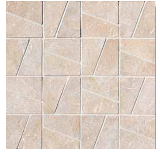
NAD10 Decor Nature White 33,3x33,3 13"x13"