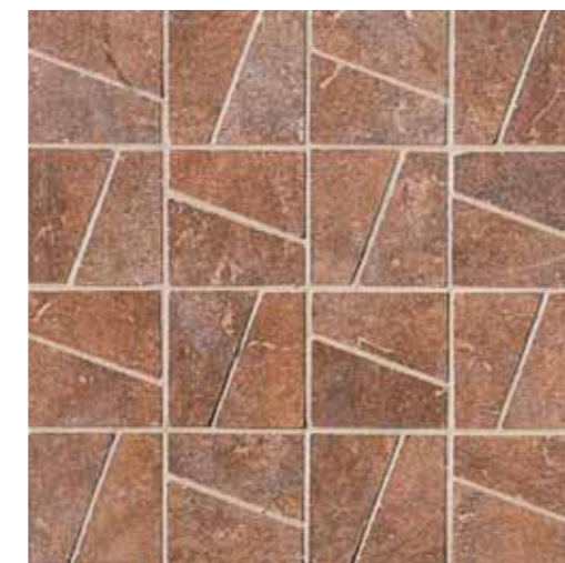
NAD50 Decor Nature Red 33.3x33.3 13"x13"