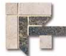
NAAT00 Ang. Treccia Nature Cold 10x10 4"x4" 518