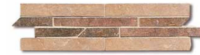
NAT13 Treccia Nature Hot 10x33.3 4"x13"