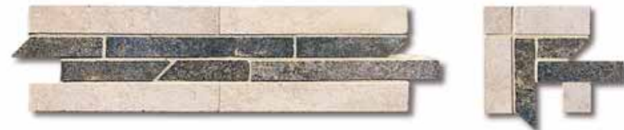
NAT00 Treccia Nature Cold 10x33,3 4"x13"