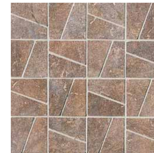
NAD70 Decor Nature Nut 33.3x33.3 13"x13"