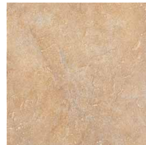
NA020 Nature Almond 33.3x33.3 13"x13"