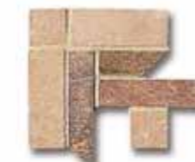
NAAT13 Ang. Treccia Nature Hot 10x10 4"x4" 518