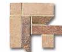
NAAT13 Ang. Treccia Nature Hot 10x10 4"x4" 518