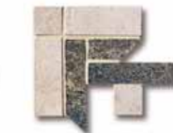
NAAT00 Ang. Treccia Nature Cold 10x10 4"x4" 518