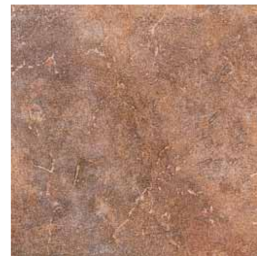
NA050 Nature Red 33.3x33.3 13"x13"