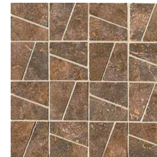
NAD60 Decor Nature Brown 33.3x33.3 13"x13"