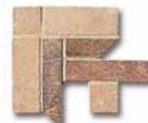
NAAT13 Ang. Treccia Nature Hot 10x10 4"x4" 518