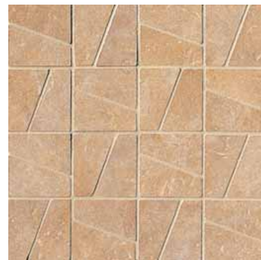
NAD20 Decor Nature Almond 33.3x33.3 13"x13"