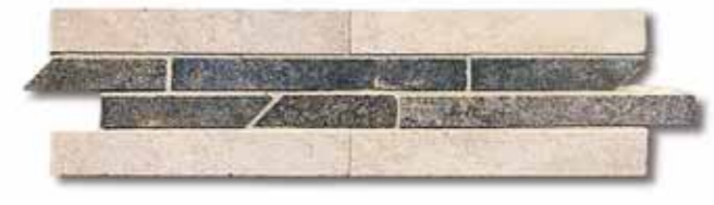
NAT00 Treccia Nature Cold 10x33,3 4"x13"