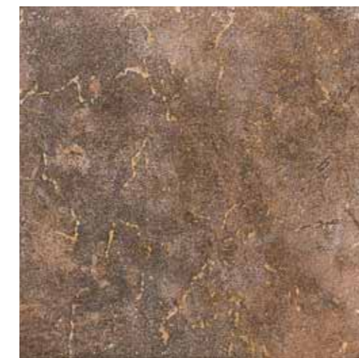
NA060 Nature Brown 33.3x33.3 13"x13"