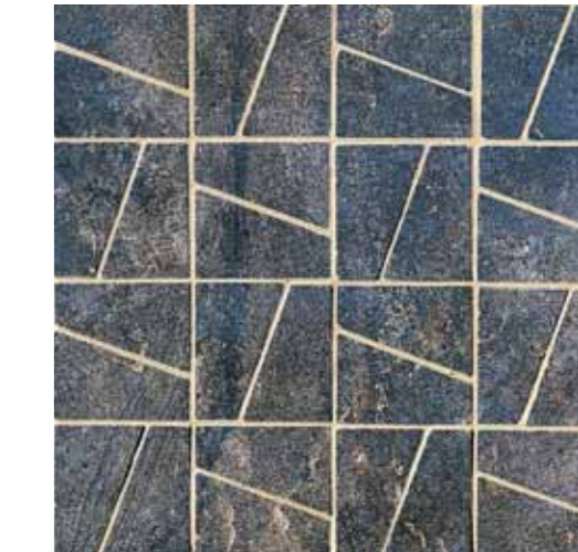
NAD30 Decor Nature Blu 33,3x33,3 13"x13"