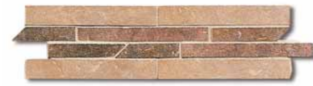
NAT13 Treccia Nature Hot 10x33.3 4"x13"