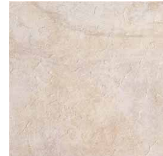
NA010 Nature White 33,3x33,3 13"x13"