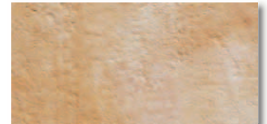
RB002 Rocca dei Borgia Riolo (Crema) 16,4x33,3 6"x13" 560

■ Materiale venduto al mq - Item sold by sqmt Article vendu au m2 - Artikel per qm verkauft