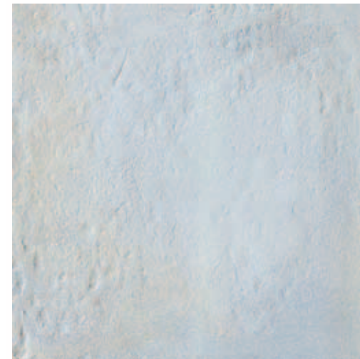
RB040 Rocca dei Borgia Nepi (Grigio) 33,3x33,3 13"x13" 556