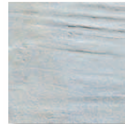
RB400 Rocca dei Borgia Nepi (Grigio) 16,4x16,4 6"x6" 564