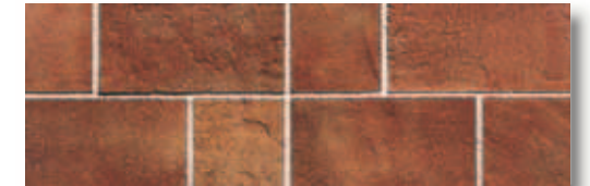
RBTF60 Rocca dei Borgia Fascia Verrucchio (Rosso) 11x33,3 4"x13" 514