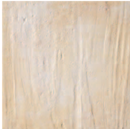
RB010 Rocca dei Borgia Rontana (Bianco) 33,3x33,3 13"x13" 556