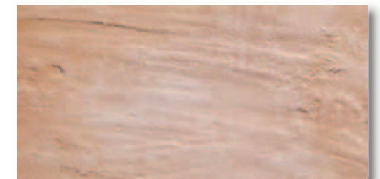
RB005 Rocca dei Borgia Montefalco (Rosato) 16,4x33,3 6"x13" 560

■ Materiale venduto al mq - Item sold by sqmt Article vendu au m2 - Artikel per qm verkauft