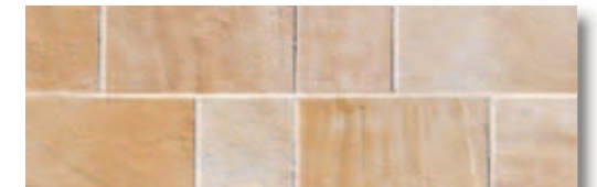
RBF20 Rocca dei Borgia Fascia Riolo (Crema) 11x33,3 4"x13" 514