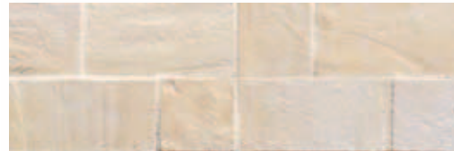
RBFT10 Rocca dei Borgia Fascia Rontana (Bianco) 11x33,3 4"x13" 514