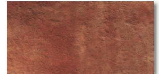
RB006 Rocca dei Borgia Verrucchio (Rosso) 16,4x33,3 6"x13" 560

■ Materiale venduto al mq - Item sold by sqmt Article vendu au m2 - Artikel per qm verkauft