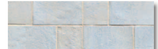
RBFT40 Rocca dei Borgia Fascia Nepi (Grigio) 11x33,3 4"x13" 514