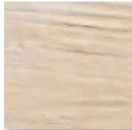
RB100 Rocca dei Borgia Rontana (Bianco) 16,4x16,4 6"x6" 564