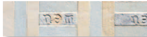
RBT02 Rocca dei Borgia Treccia Fredda 8x33,3 3 18 "x13" 528