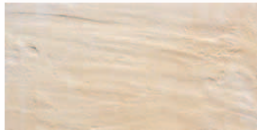
RB001 Rocca dei Borgia Rontana (Bianco) 16,4x33,3 6"x13" 560