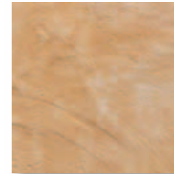
RB200 Rocca dei Borgia Riolo (Crema) 16,4x16,4 6"x6" 564