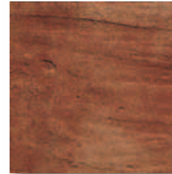
RB600 Rocca dei Borgia Verrucchio (Rosso) 16,4x16,4 6"x6" 564