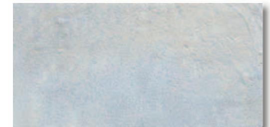
RB004 Rocca dei Borgia Nepi (Grigio) 16,4x33,3 6"x13" 560

■ Materiale venduto al mq - Item sold by sqmt Article vendu au m2 - Artikel per qm verkauft