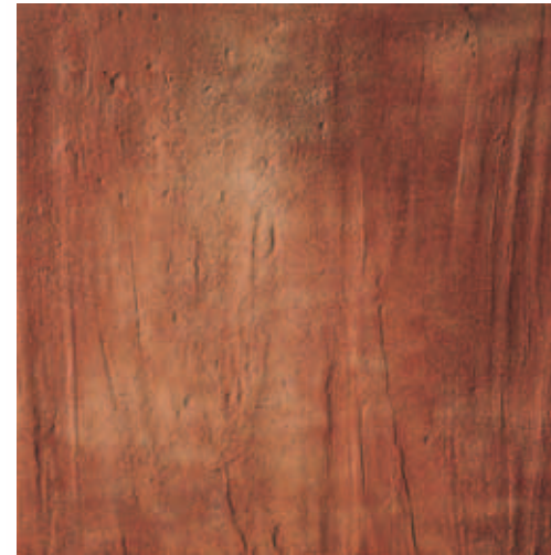
RB060 Rocca dei Borgia Verrucchio (Rosso) 33,3x33,3 13"x13" 556