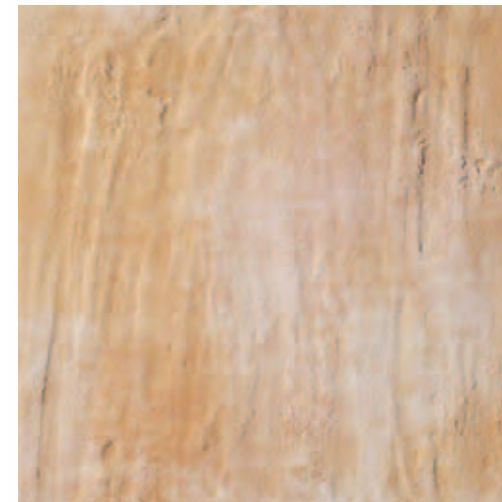
RB020 Rocca dei Borgia Riolo (Crema) 33,3x33,3 13"x13" 556