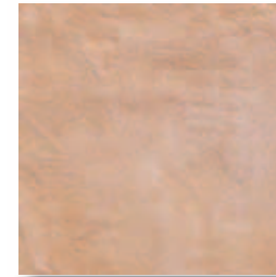
RB500 Rocca dei Borgia Montefalco (Rosato) 16,4x16,4 6"x6" 564