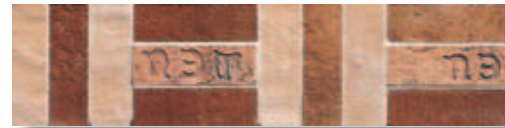
RBT01 Rocca dei Borgia Treccia Calda 8x33,3 3 18 "x13" 528