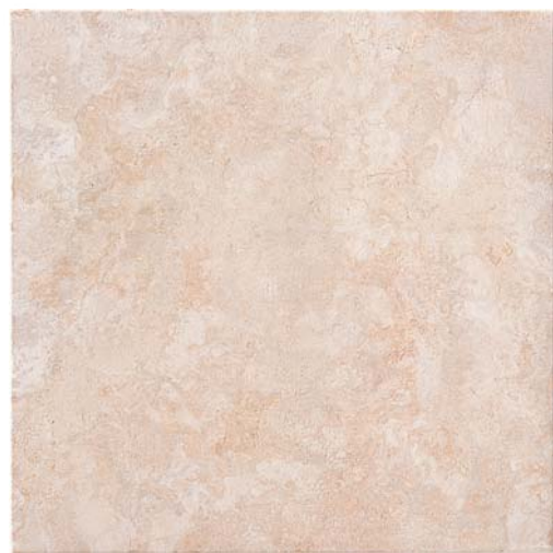
SEAO50 Spring Pink 33,3x33,3 13"x13"