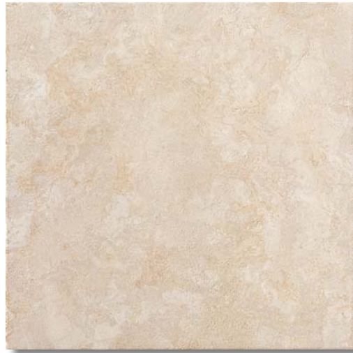
SEAO20 Autumn Cream 33,3x33,3 13"x13"