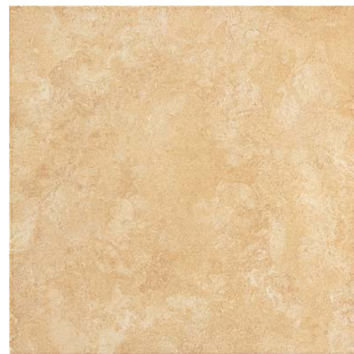
SEAO80 Summer Gold 33,3x33,3 13"x13"