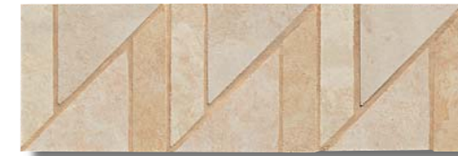
SEAT00 Season Treccia 11x33,3 4"x13"