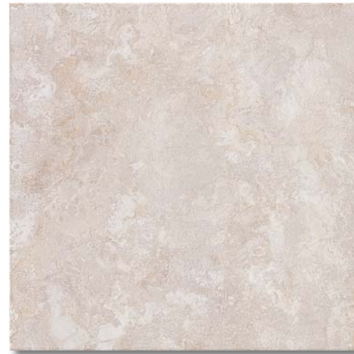
SEAO40 Winter Grey 33,3x33,3 13"x13"